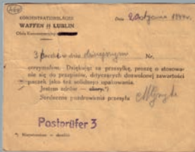
Postkarte eines polnischen Häftlings an seine Eltern vom Januar 1944.

Die privaten Dokumente bestehen größtenteils aus Postkarten und Briefen. Zu beachten ist, dass diese privaten Quellen, die durch die Postprüfung gingen, die Lagerwirklichkeit nicht objektiv schildern. Daneben gibt es auch als persönlich geltende amtliche Dokumente. Sie waren von Behörden angelegt, zählten jedoch zum Besitz des Häftlings, z.B. Pässe, Ausweise und Arbeitskarten.