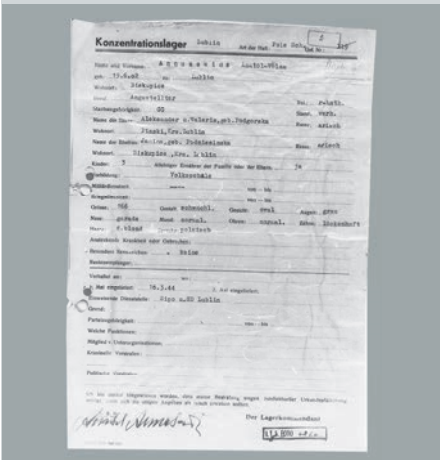
Personalbogen des polnischen Häftlings Anatol-Wclaw (?) Annusewicz von 1944.

Die bürokratische Erfassung der Häftlinge war die Grundlage für das gesamte System des Konzentrationslagers, nicht nur im KL Majdanek. Für neue Häftlinge wurde möglichst früh nach der Feststellung ihrer Arbeitsfähigkeit ein Personalbogen mit genauen Angaben zur Herkunft des Häftlings, zu körperlichen Merkmalen und zum Einlieferungsgrund ausgefüllt. Erst nach dieser Registrierung war die Person offiziell im Lager als Häftling inhaftiert. Gleichzeitig wurden Listen und Personalkarten über mitgebrachte Wertgegenstände und Geldbeträge erstellt, die die Häftlinge bei der Einlieferung abgeben mussten. Starb ein Häftling, erfolgte ein kurzer Vermerk im Personalbogen.